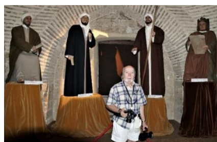
Między trzema mędrcami i królem Kastylii

Gwadalkiwir i dotarliśmy do ciekawego Museo Vivo de Al Andalus. Zaraz przy wejściu spotkałem filozofa Majmonidesa, sefardyjskiego Żyda, Averroesa - myśliciela islamskiego i historyka,