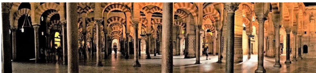
Nastrojowe wnętrze Katedry Wniebowzięcia NMP

W 13 wieku meczet zamienił się w niezwykle oryginalną Katedrę Wniebowzięcia Najświętszej Marii Panny.