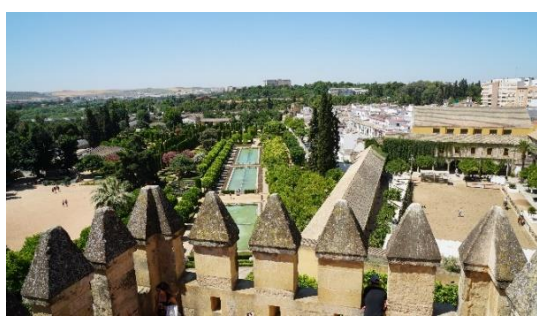
Widok z zamku, ogrody i po prawej stajnia i ujeżdżalnia

W 13 wieku meczet zamienił się w niezwykle oryginalną Katedrę Wniebowzięcia Najświętszej Marii Panny.