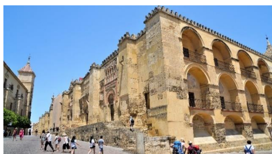
Mezquita - obecnie Katedra Wniebowzięcia NMP

Zapraszam teraz po niezwyklej Sewilli, do niezwyklej Cordoby. Mieszkaliśmy w tradycyjnym hotelu, gdzie czuło się przeszłość. Na ścianie, w głębi namalowany jest Kolumb, królowa Izabella i Ferdynand Aragoński. Hotel znajduje się zaraz koło dawnego meczetu – Mezquita .