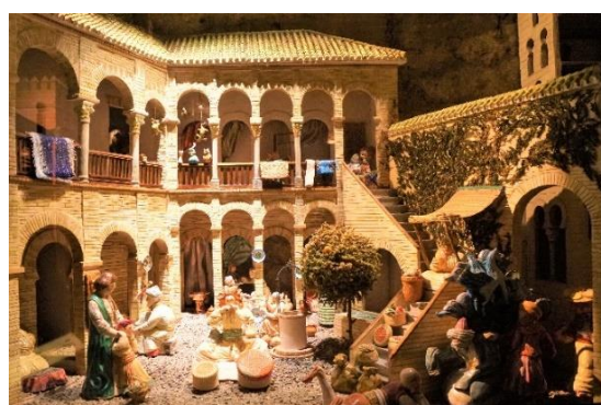
Handel w mieście

I wpadłem w kompleks, że my tym w okresie, to raczej jeszcze polowaliśmy i zbieraliśmy grzyby, a „Polska murowana” pojawiła się dopiero w 14 wieku za Kazimierza Wielkiego.