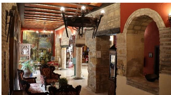
Wnętrze hotelu Hacienda Posada de Vallina