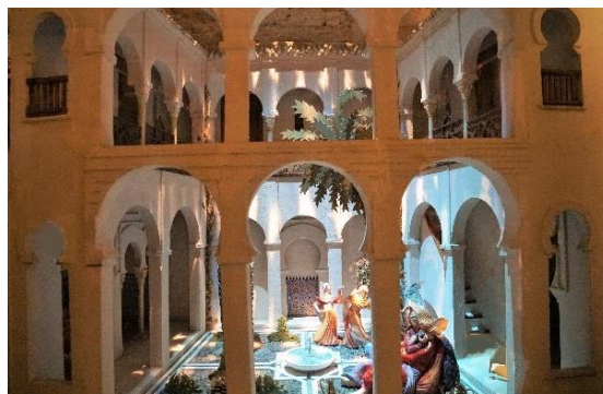
Andaluzyjski dom - czas relaksu

Tu wśród makiet i obiektów dawnej sztuki za szybami zanurzyliśmy się w czasy potężnego władcy Abd Al -Rahmana III (891 - 961), który utworzył pierwszy kalifat.