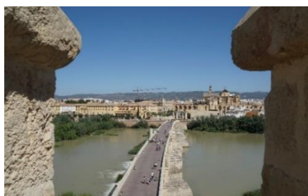
Widok z wieży Museo Vivo na Mezquita po

Po „zdobyciu” zamku Alkazar, który był pierwszą rezydencją Isabelli i Ferdynanda Aragońskiego, ostatkiem sił przeszliśmy przez most na rzece