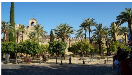
Zamek Chrześcijańskich Królów - Alkazar

Meczet był budowany w czasach, gdy podobno żydzi, muzułmanie i katolicy żyli w tym mieście w harmonii.