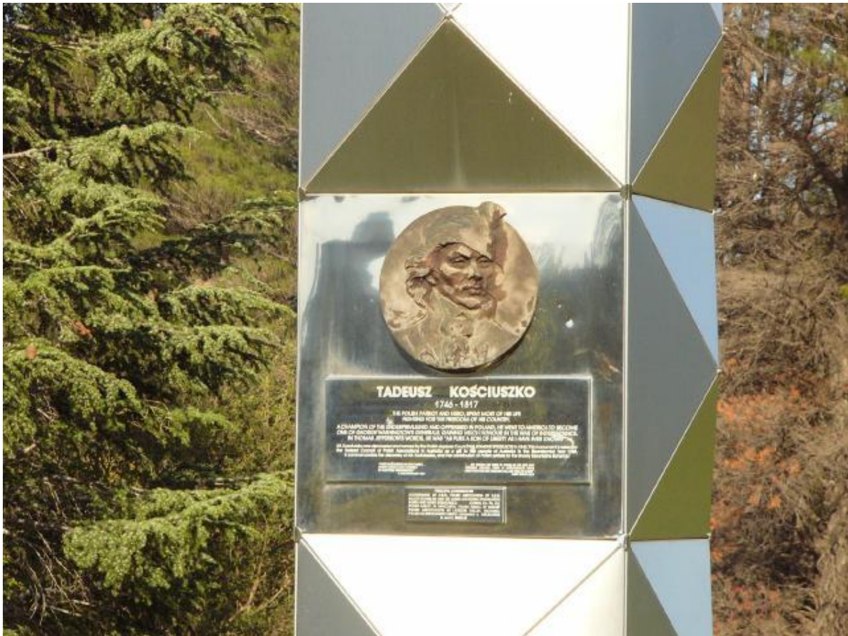
Medalion i tablica