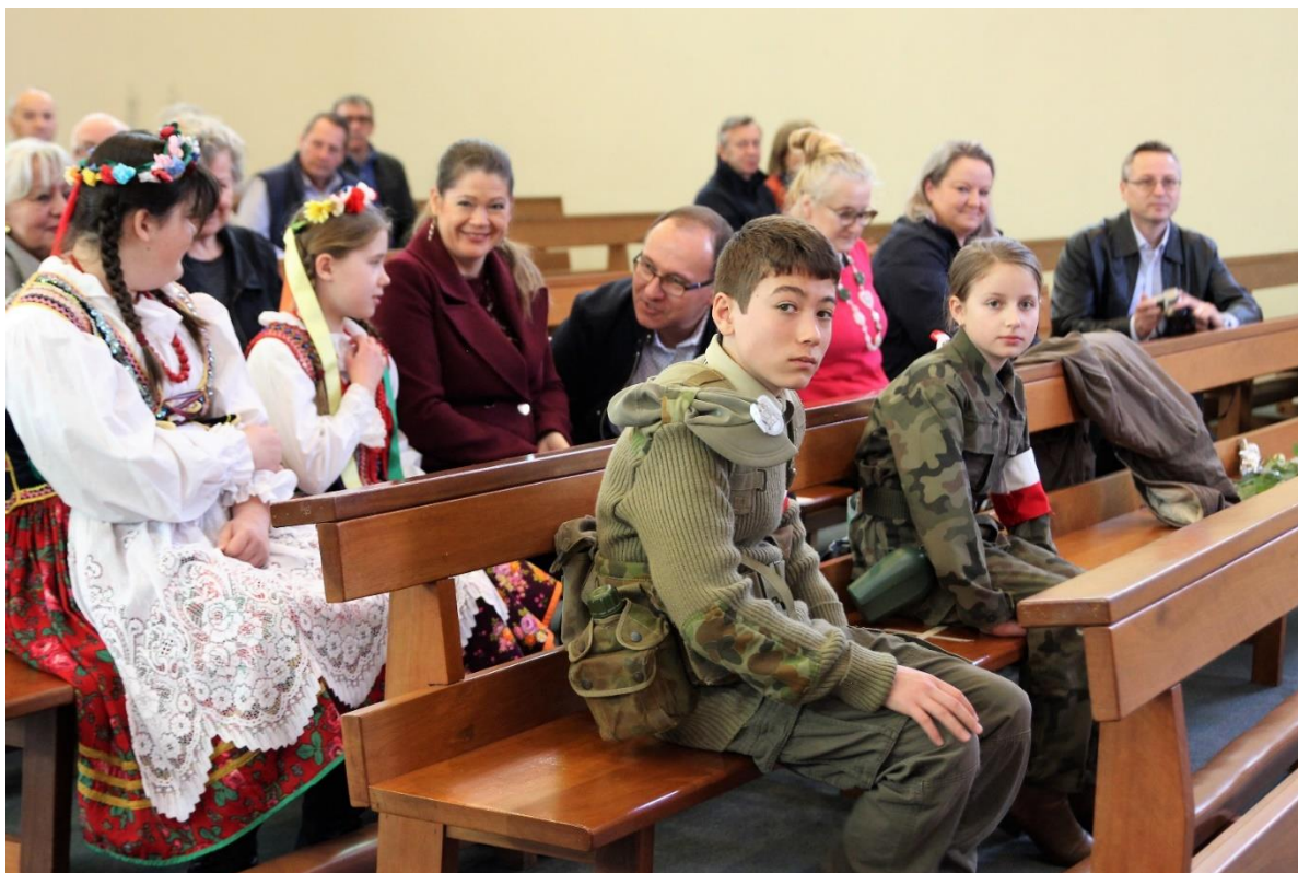
Dzieci z Polskiej Szkoły Sobotniej im A, Mickiewicza w strojach powstańczych oraz ludowych