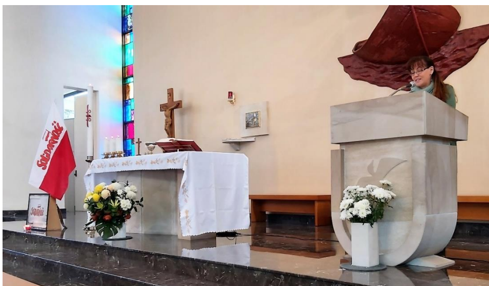
Ania Gołąb pięknie recytując wiersze z tomiku 'Wiersze 80'