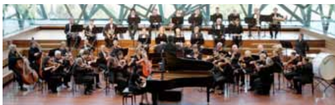
ORKIESTRA SYMFONICZNA ZELMANA