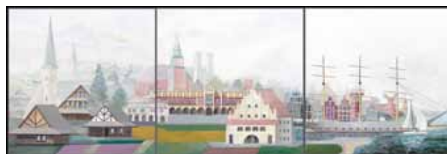
ALEGORIA POLSKA - JERZY GLAC