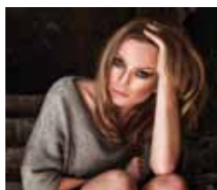
ANNA MARIA JOPEK