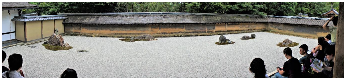
Ryoanji - kare sansui

Inną sławną świątynią w Kioto, znaną z ogrodu w stylu buddyjskiej filozofii Zen jest świątynia Ryoanji (1450 r). Tym razem ogród jest bez roślin – kare-sansui czyli tylko suchy pejzaż .