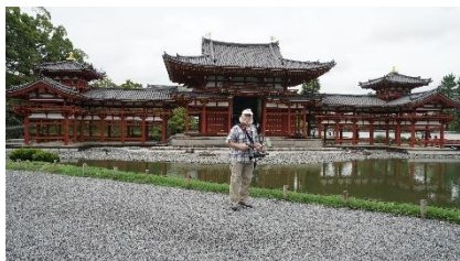
Autor na tle świątyni Byodoin