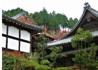
Yoshiminedera w Kioto - Nagaoka

Ogród ten uważany jest za przykład jednego z najlepszych, autentycznych ogrodów, sprzyjający uwolnieniu umysłu od wszelkich ograniczeń. Jego znaczenie i co reprezentuje, zależy już tylko od interpretacji zwiedzających.