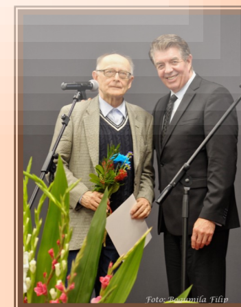
Gala Konkursowa.