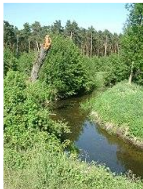
Rzeka Głuszynka