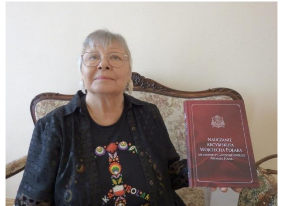
Redaktor naczelna „Pulsu Polonii” Sydney i Prezes Kościuszko Heritage Inc