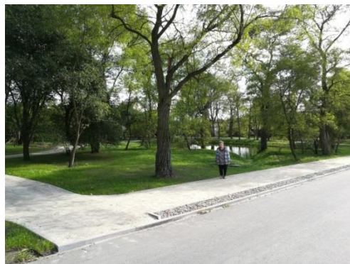
Park Strzeleckiego

Australia „Szlak Strzeleckiego „ pomnikami usłała, Za odkrywcę i wielkiego człowieka uznała. Polonia i Kościuszk Heritage ma go też w swojej pieczy, Łaskawy dla niego był los człowieczy.